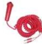
Poire d'Arrivée Manuelle