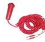
Doublage* arrivée manuelle

* IMPORTANT : Lors de l'utilisation d'un système automatique et semi-automatique, il est souhaitable que doubler par un chronométrage manuel.